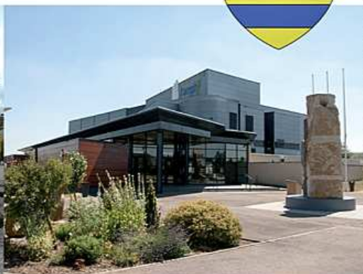
L'Espace culturel «L'amphy»