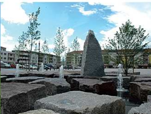
L'Esplanade la Brasserie