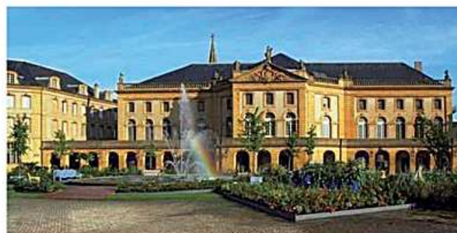
Opéra - Théâtre