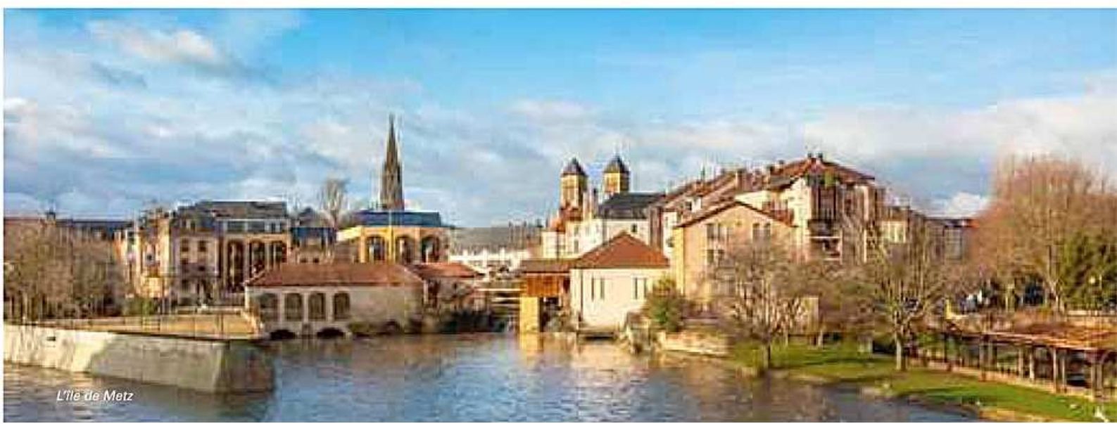
L'île de Metz